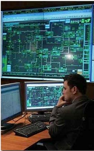
Az FGSZ siófoki diszpécserközpontja.

A terepi berendezések kezelése a SCADA szervereken TCP/IP csatornákon keresztül